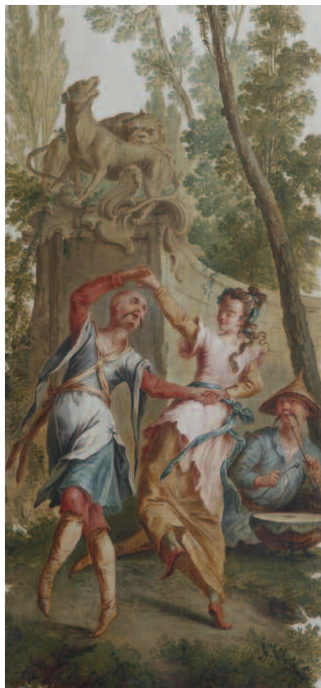
Scène de danse