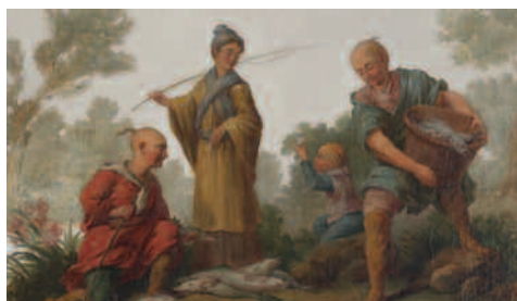
Scène de pêche