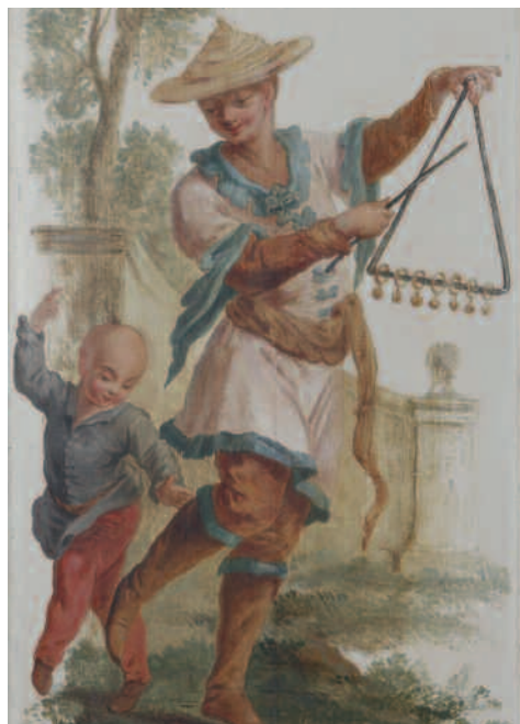
Scène de musique