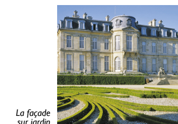
La façade sur jardin

L'architecte Jean-Baptiste Bullet de Chamblain élève, entre 1703 et 1707, la maison de plaisance de Paul Poisson de Bourvillais. L'arrestation de ce financier entraîne la vente du domaine, adjugé